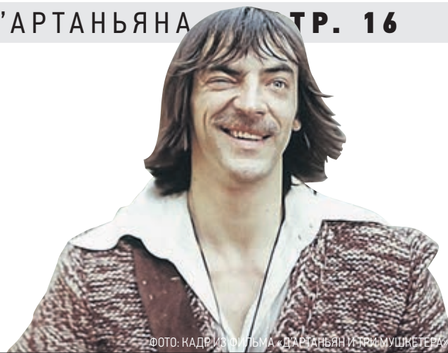
ФОТО: КАДР ИЗ ФИЛЬМА «Д'АРТАНЬЯН И ТРИ МУШКЕТЕРА»

ИЗДАНИЕ ПРАВИТЕЛЬСТВА САНКТ-ПЕТЕРБУРГА • SPBDNEVNIK.RU • VK.COM/SPBDNEVNIK • TWITTER.COM/DNEVNIKSPB • FACEBOOK.COM/SPBDNEV • INSTAGRAM.COM/DNEVNIK.SPB • OK.RU/DNEVNIKSPB ☁️ t°C +1...+3 ветер 2-3 м/с, з 16+