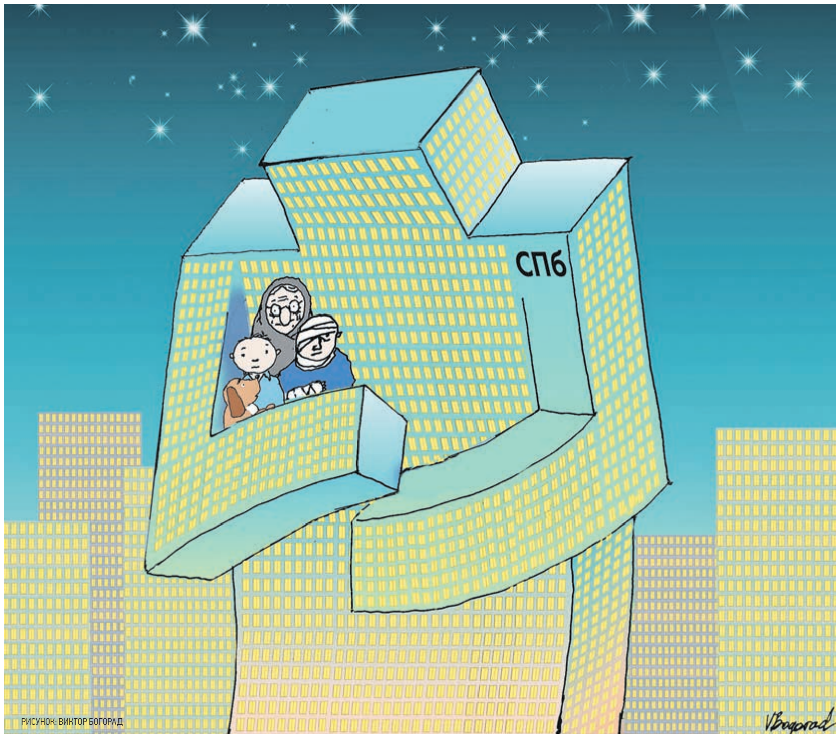
РИСУНОК: ВИКТОР БОГОРАД

ИЗДАНИЕ ПРАВИТЕЛЬСТВА САНКТ-ПЕТЕРБУРГА • SPBDNEVNIK.RU • VK.COM/SPBDNEVNIK • TWITTER.COM/DNEVNIKSPB • FACEBOOK.COM/SPBDNEV • INSTAGRAM.COM/DNEVNIK.SPB • OK.RU/DNEVNIKSPB ☁️ t°C +1...+3 ветер 2-3 м/с, з 16+