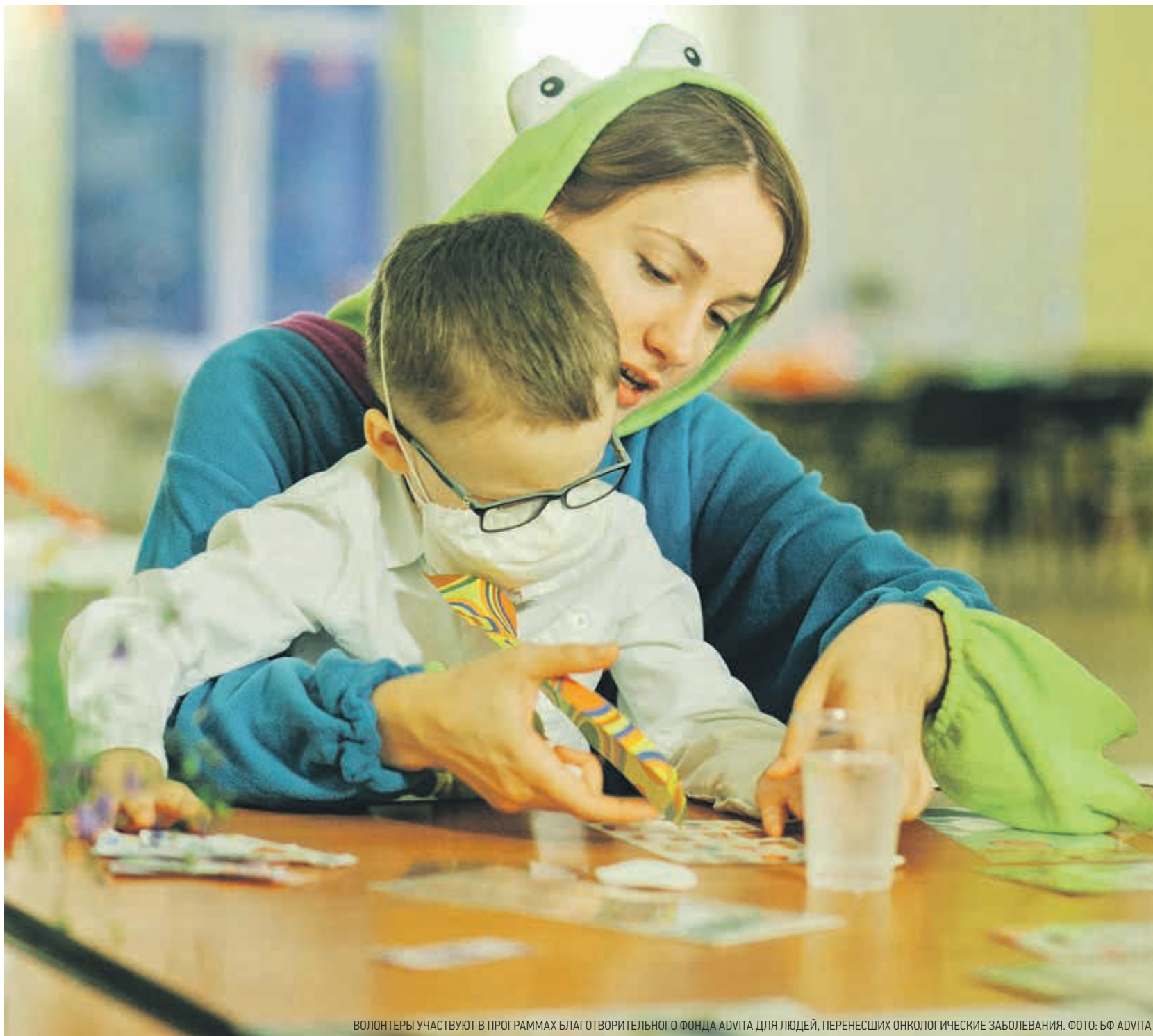
ВОЛОНТЕРЫ УЧАСТВУЮТ В ПРОГРАММАХ БЛАГОТВОРИТЕЛЬНОГО ФОНДА ADVITA ДЛЯ ЛЮДЕЙ, ПЕРЕНЕСШИХ ОНКОЛОГИЧЕСКИЕ ЗАБОЛЕВАНИЯ.

ИЗДАНИЕ ПРАВИТЕЛЬСТВА САНКТ-ПЕТЕРБУРГА • SPBDNEVNIK.RU • VK.COM/SPBDNEVNIK • TWITTER.COM/DNEVNIKSPB • FACEBOOK.COM/SPBDNEV • INSTAGRAM.COM/DNEVNIK.SPB • OK.RU/DNEVNIKSPB t°C -5...-7 ветер 5-6 м/с, с 16+